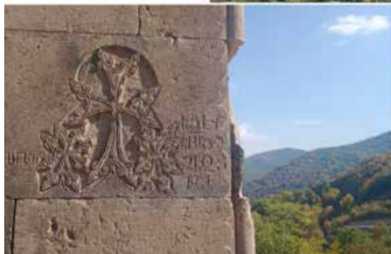
Armenialainen kiviristi eli khatškari (alla)