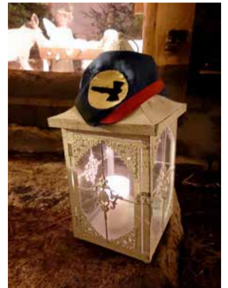
Marttilan Marttien rauhantulilyhty. Rauhantuli on tarkoitettu levitettäväksi. Lisää tietoa saat Lounais-Suomen partiopiiri ry:n sivuilta – käytännöllisiä tulenkäsittely- ja paloturvallisuusohjeita myöten – sekä Betlehemin Rauhantulen Facebook-ryhmästä.