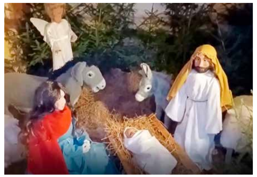
Marttilan kirkkomaan jouluasetelma viime jouluna. Kuva Juha Nummilan videosta.

Marttilan kirkon vieressä on entisen nimismiehen perheen sukhauta. Toisena adventtina tila muuttuu Betlehemin talliksi, joka on nähtävillä loppiaiseen saakka. Edessä palavat Betlehemin rauhantulen lyhdyt.