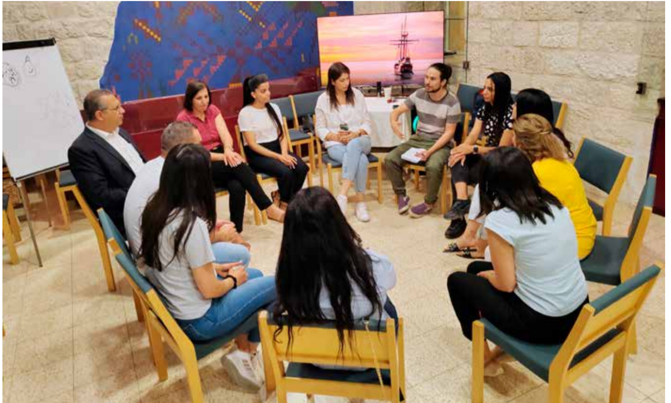
Kummikoulujen henkilökuntaa voimaannuttamispäivässä.

– Yksilökeskustelut ja kriisityö onlinein kautta on tärkeää. Tuemme paikallisia toimijoita heidän jaksamisessaan. Tarjoamme keskusteluapua ja menetelmiä kou-