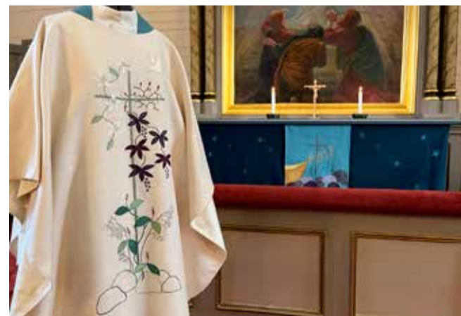
Kuusjoelle suunniteltiin vain yksi kasukka, jonka symboliikassa näkyy koko kirkkovuoden kulku. Papin yllä oleva stola vaihtuu ajankohdan mukaan.