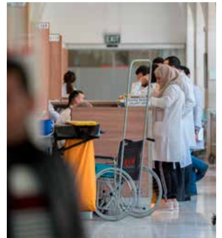
Kuva Augusta Victoria -sairaala Itä-Jerusalemista.

loppuneet. Yhteiskunnassa ei ole minkäänlaista sosiaalitukea. Perheet ovat jo entuudestaan eläneet toimeentulon rajalla. On myös perheitä, joilla ei ole perheyhteisönsään niitä, jotka voisivat antaa omastaan.