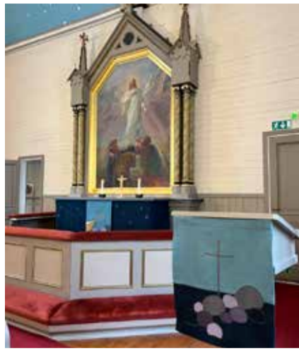
Kuusjoen kirkko puetaan toisena adventtina siniseen väriin.

– Ne jokainen voi tuoda omasta kuormastaan ristin juurelle. Näiden kivikoiden yllä kasvaa toivoa tuovat villiviinin köynnökset. Meidänkin leveysasteilla menes-