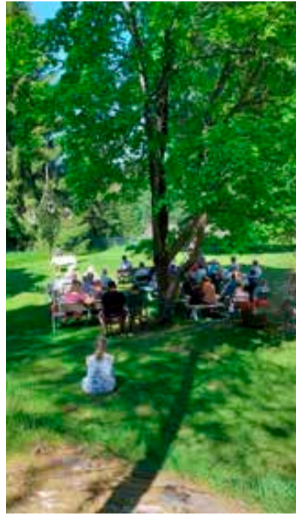
Juvankosken kesäkodilla Perttelissä kansanlaulukirkko la 24.6. klo 12.