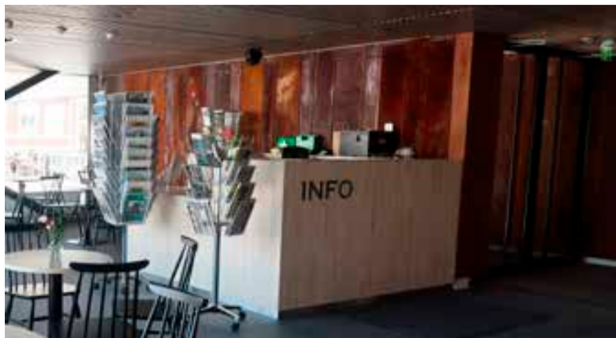
Infopiste löytyy ensimmäisen kerroksen aulasta heti pääovien luota. Infossa palvelaan pääsääntöisesti ma-to klo 9–13.