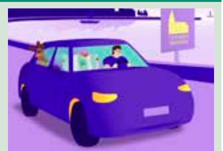
Halikko, Perniö ja Teijo ovat tiekirkkoja.

Sairaalantie 5 7.6.–6.8. ke–su klo 11–17. Juhannusaattona ja juhannuspäivänä suljettu.