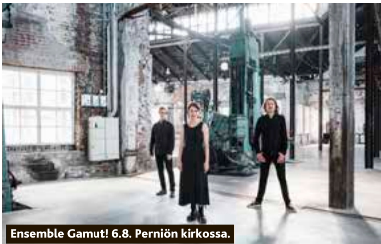
Ensemble Gamut! 6.8. Perniön kirkossa.

Lauluyhtye Valven konsertti käsittelee rakautta, elämää, kasvuja ja kuihtumista, peilaten ihmisen tunteita ympäröivään luontoon.