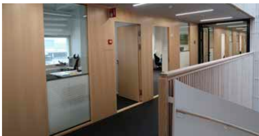
Seurakuntatalon kolmannessa kerroksessa sijaitsevat hautapalvelut, seurakuntatoimisto ja taloustoimisto. Kerroksessa on kirkkoherran työhuone sekä hallinto-, henkilöstö- ja kiinteistöpalveluiden työtilat. Neljännessä kerroksessa työskentelee viestinnän, varhaiskasvatuksen, nuoriso- ja rippikoulutyön, lähetysten ja kansainvälisen työn, diakonian ja emäntäpalveluiden työntekijöitä.