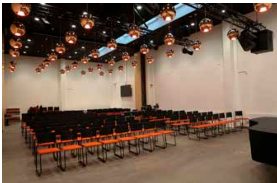
Seurakuntatalon ensimmäisessä kerroksessa on Juhlasali, jonka voi tarvittaessa jakaa Vaskisaliin (mahtuu 40 hlöä) ja Kuparisaliin (150 hlöä).