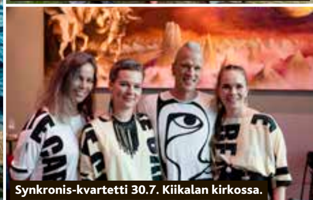
Synkronis-kvartetti 30.7. Kiijalan kirkossa.