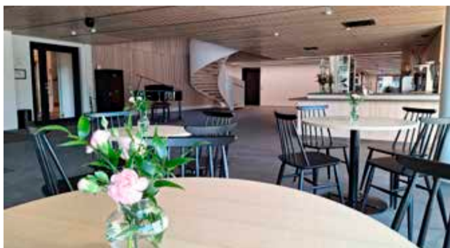
Aulasta löytyy kahvila Manna, joka on avoinna ensimmäisen kerran Lähetysjuhlien aikana. Syyskuusta lähtien kahvila on avoinna lähempänä ilmoitettavina aikoina.