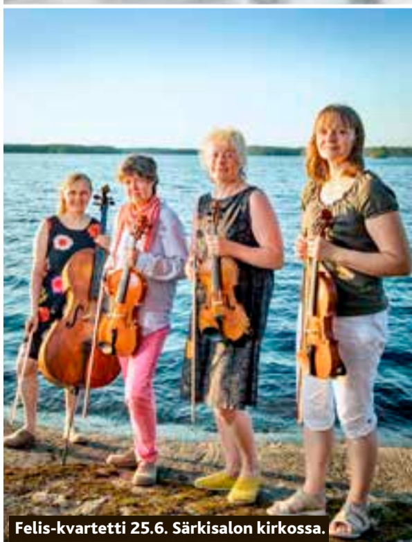
Felis-kvartetti 25.6. Särkisalon kirkossa.