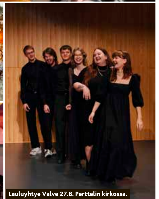
Lauluyhtye Valve 27.8. Perttelin kirkossa.