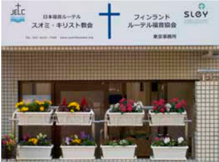
Suomi-kirkon seurakunta toimii Tokion keskustan yliopistoalueella Wasedassa.

suuri tapahtuma. Japanilaisen kohdalla tie kasteelle on pitkä, koska vanhoista perinteisistä uskonnoista, buddhalaisuudesta ja shintolaisuudesta, eroaminen ei ole helppoa eikä yksinkertaista. Monet käyvät kirkossa usean vuoden ajan ennen kuin kaste tulee ajankohtaiseksi. Tälläkin hetkellä jumalanpalveluksiin osallistuu nuori nainen, joka on käynyt jo viisi vuotta ja tuntee paljon Raamattua.