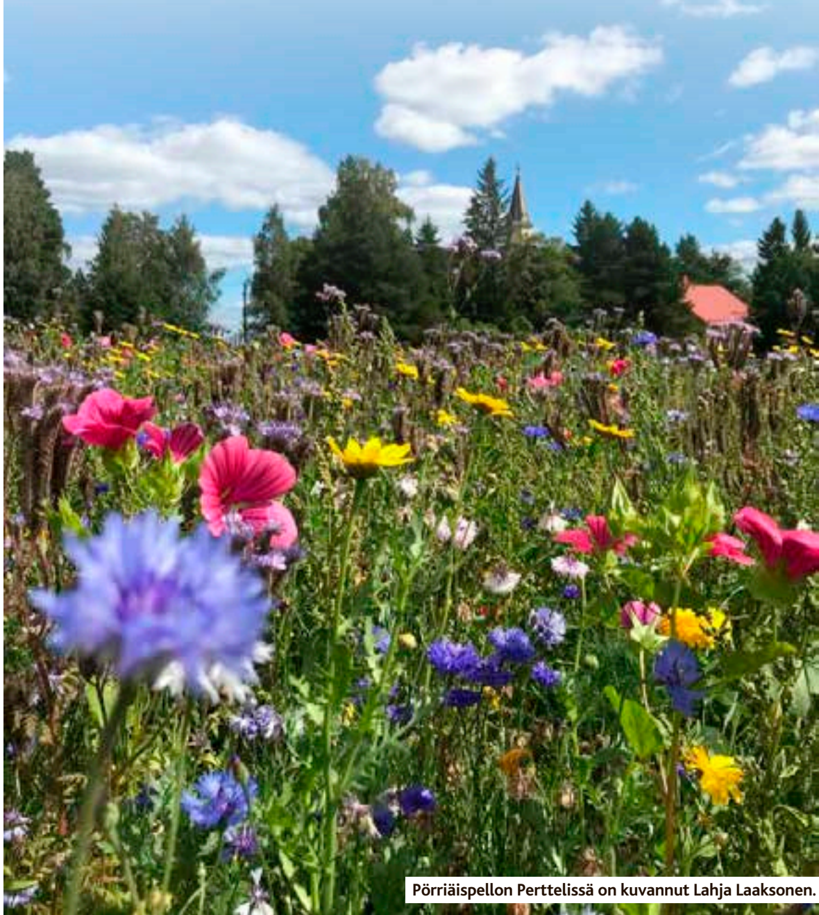
Pöriäispellon Perttelissä on kuvannut Lahja Laaksonen.