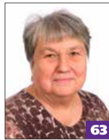
Iho Irma FM, eläkeläinen