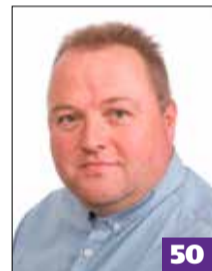
Pouke Iiro projektipäällikkö