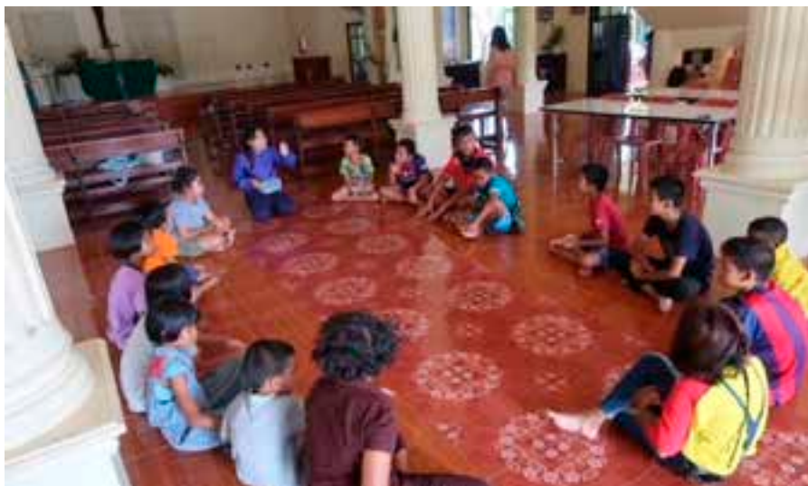
Kirkko on lapsille turvallinen paikka.

moivia lapsia ja nuoria, joilla on edellytyksiä vaikka mihin. Minun roolini työssä on ollut auttaa työntekijöitä huomaamaan tapahtuneet muutokset ja auttaa heitä hallinnollisissa asioissa. Yhdessä olemme miettineet toimintatapoja eteen tulleisiin tilanteisiin. Lisäksi minä saan kysyä hyviä ja huonoja