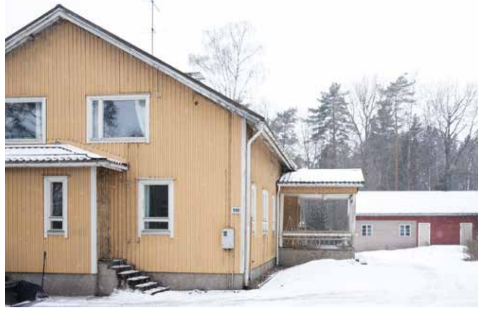
Kuusjoen pappila myytiin yksityiskodiksi.

vikkeet vähävaraisille salonseutulaisille asiakkailleen.