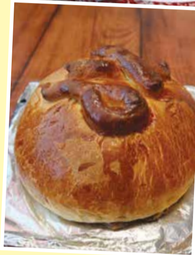
Perinteinen tapa on laittaa pashaa kulitsan (pääsiäispullan) viipaleiden päälle, mutta molempia voi syödä erikseenkin.