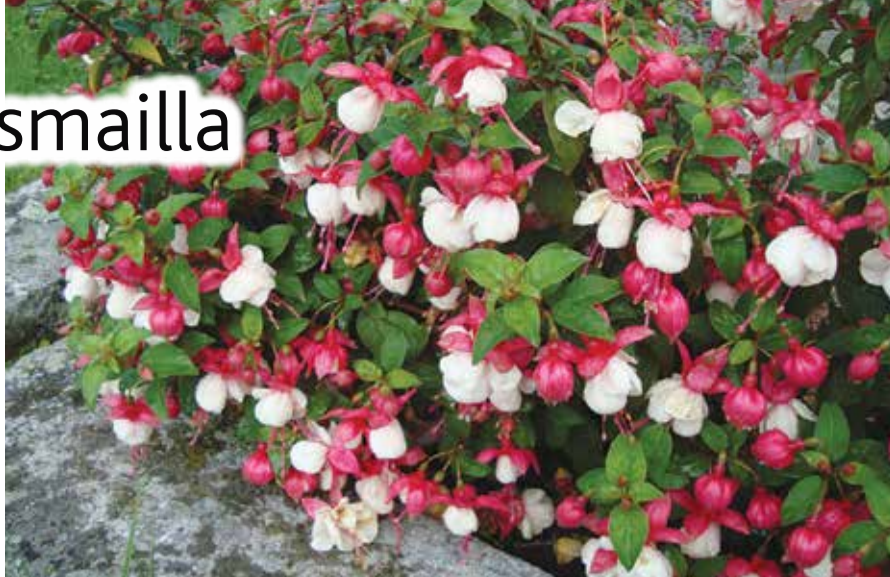
Salon seurakunnan hoidettavaksi annetuille haudoille istutetaan tulevana kesänä noin 60.000 kukkaa. Valikoimaan kuuluu muun muassa verenisaroita.

Haudanhoitosopimuksia hoitokaudeksi 2021 voi tehdä 30.6. saakka. Samaan päivään mennessä pitää tilata myös syksyn havutukset ja kanervat. Jos haudalle haluaa