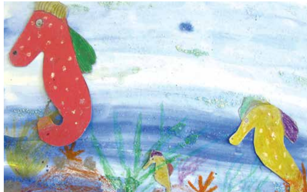
Angelniemen taidepajassa tehtyä taidetta muutaman vuoden takaa.

Lisätiedot ja ilmoittautumislomake: www.salonseurakunta.fi/lapset .