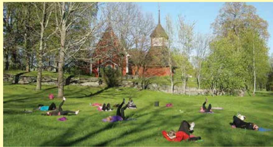
Särkisalon kirkkopuistossa jumppaajilla on tilaa pitää turvavälit.

Monta vuotta vienyt hautakirjanpidon saattaminen ajan tasalle ja siihen liittyvät kuulutukset hautojen hallinta-aikojen päättymisestä on saatu päätökseen. Kuluva vuoden ajan pidetään kuulutuksissa taukoa. Sen jälkeen hallinta-aikojen päättymiset on tarkoitus tarkistaa ja kuuluttaa joka toinen tai kolmas vuosi eli osa hautausmaista kerrallaan. Kuulutusmäärät ovat kuitenkin huomattavasti pienempiä nyt kun hautakirjanpito on kertaalleen saatu ajan tasalle kaikilla hautausmailla.