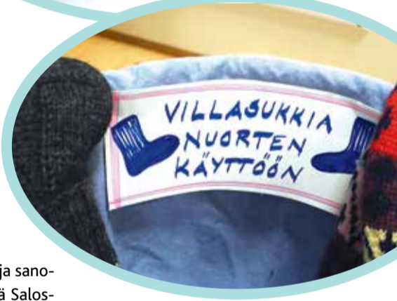
Lämpimät villasukat päihittävät kylmänpuoleiset lattiat.