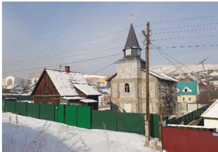
Ulan-Uden kirkkotoyömaalla on edetty lämpöeristys- ja sisätöihin.

Lähetyslennot järjestävä MAF eli Mission Aviation Fellowship on 1945 perustettu kristillinen järjestö, joka operoi yli sadalla lentokoneella kehitysmaissa alueilla, missä etäisyydet ovat pitkiä ja maantiet puuttuvat tai ne ovat vaikeakulkuisia ja turvattomia.