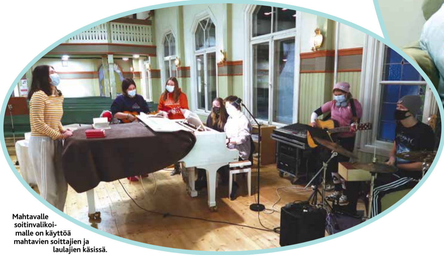
Mahtavalle soitinvalikomalle on käyttöä mahtavien soittajien ja laulajien käsissä.

la. Voisihan ajatella vaikka niin, että elämän laavaa siellä varustetaan, tavallaan?