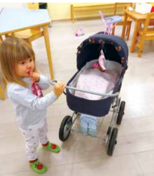
Ei saa meluta, ettei vauva herää!