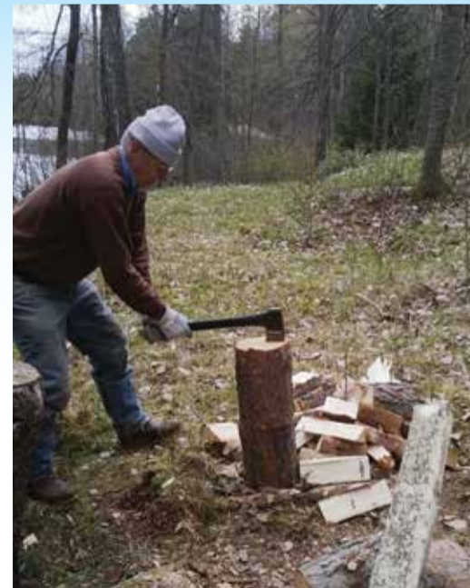
Äijä on leirikeskuksesta usein nähty talkootöissä, mutta olisiko ensi syksynä tilausta miesmäiselle retriitille?

Mitäs meinaat? Sopisiko sinulle? Koikeilisitko ainakin? Salon seurakunta järjestää, jos Luoja suo ja koronatilanne myöten antaa, retriitin miehille Reilan