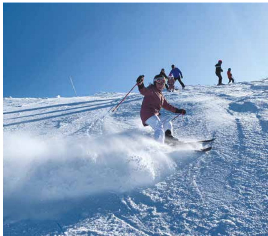
Lasketteluriparilaiset matkaavat tänä vuonna Ären sijasta Pyhätunturille.

su 14.2., 7.3. ja 21.3. klo 15.30 seurakuntakodissa, Hämeenojankatu 19.