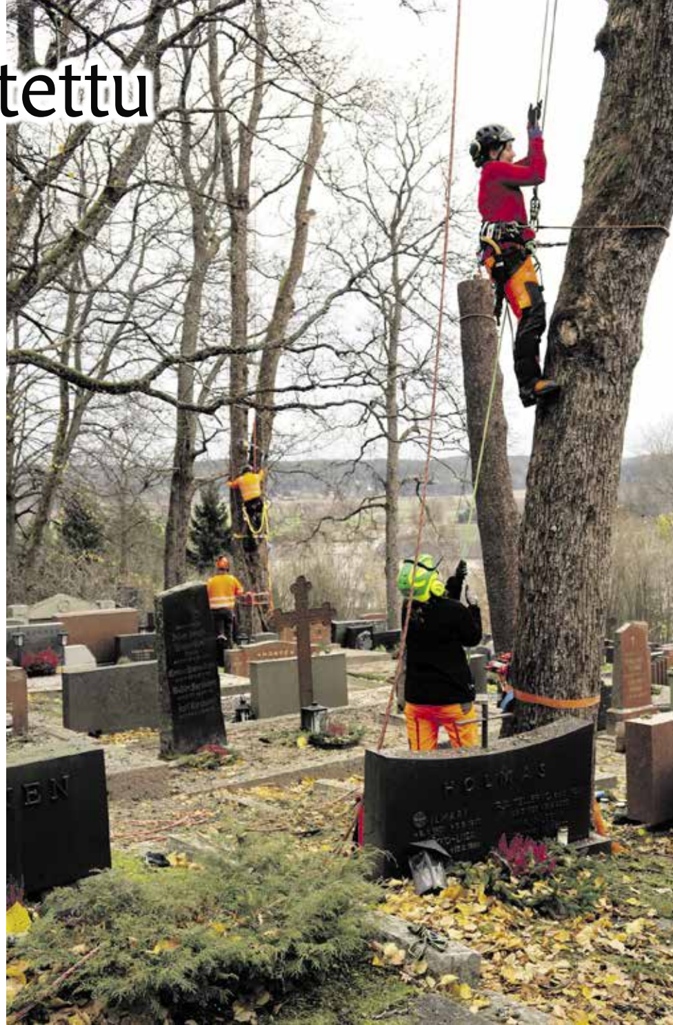
Marraskuun alussa Uskelan kirkkohautausmaalla karsittiin huonokuntoisia puita. Monenlaista varovaisuutta vaativan työn hoitivat ammattiopisto Livian toisen vuoden arboristiopiskelijat, joille tämä oli samalla kiipeillenkaadon näyttökoe.

Kuluvalta vuodelta peruuntui koronan takia monta yhteissyntymäpäivjuhlaa, ja juhla-järjestelyt ovat edelleen epävarmoja ainakin alkuvuoden osalta. Siksi kutsukirjeitä ei