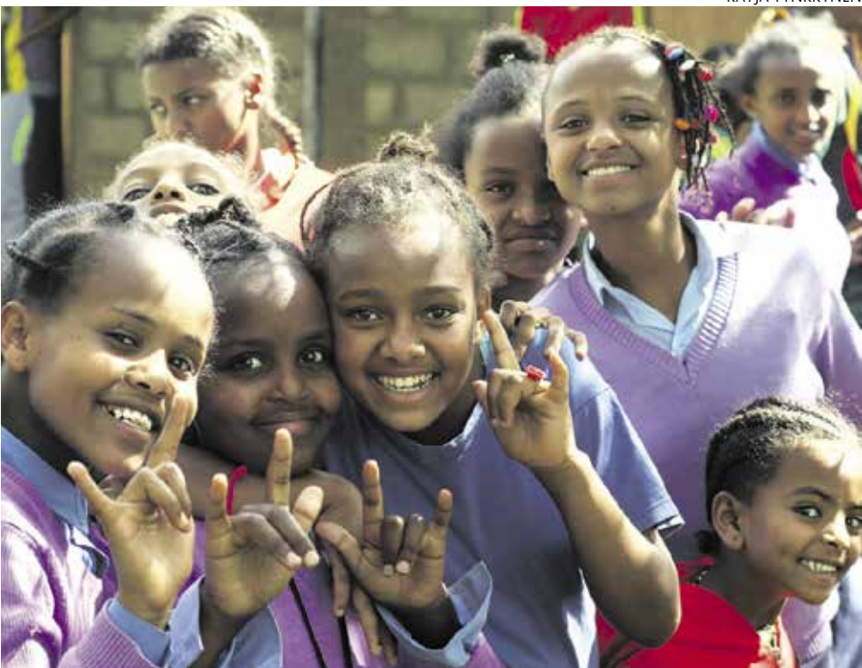
Hosainan kuurojenkoulu on raivannut tietä kuurojen lasten oikeudelle oppia.