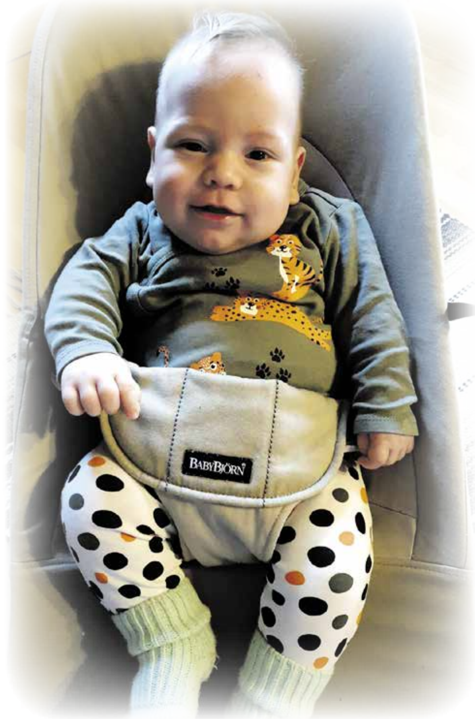
Noelilla on edessä ensimmäinen joulu kotona Kiikalan Hirvelän kylässä.