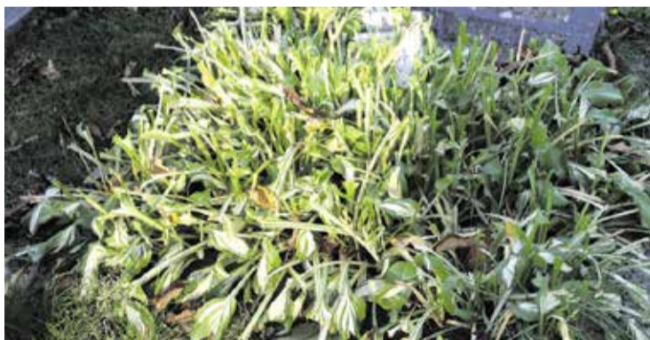
Kuunliljat, orvokit, ruusut – melkein kaikki kelpaa peuroille, jotka Kiskossa aiheuttavat huolta niin omaisille kuin hautausmaata töikseen hoitaville. Kerrotaan, että joskus on kukkavihot haudalta syöty jo ennen kuin vainajan muistotilaisuus on seurakuntatalossa päättynyt.