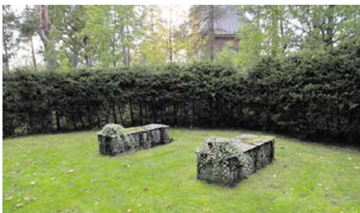
Vastapäätä kirkkoa ja hautausmaata on ruumiskivet, joilta arkkuja lähdetään saattamaan hautaan.