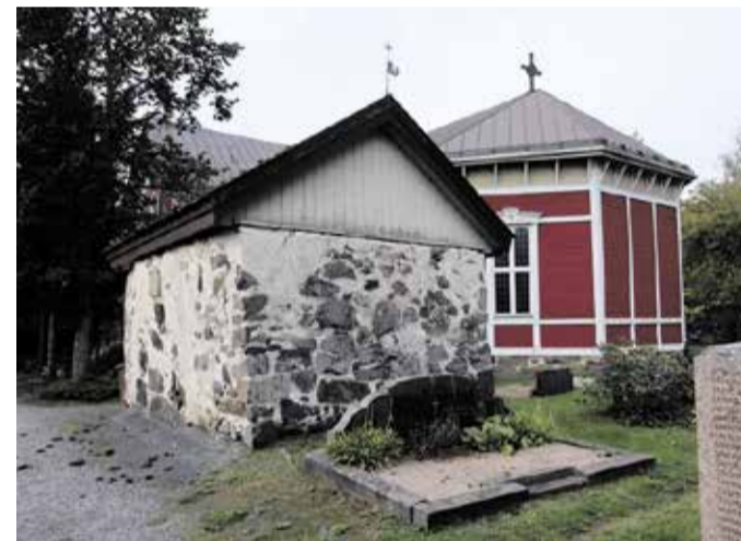
Horn-suvun keskiaikaisen hautakappelin siirrettyä 1700-luvulla seurakunnalle arkut poistettiin ja perimätiedon mukaan niiden hopeakoristeista tehtiin ehtool-liskalusto. Rakennus toimi sen jälkeen ruumishuoneena 1970-luvulle saakka.