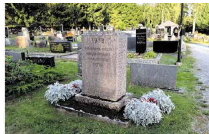
Vakaumuksensa puolesta kuolleiden muistomerkeissä on nelisenkymmentä nimeä.