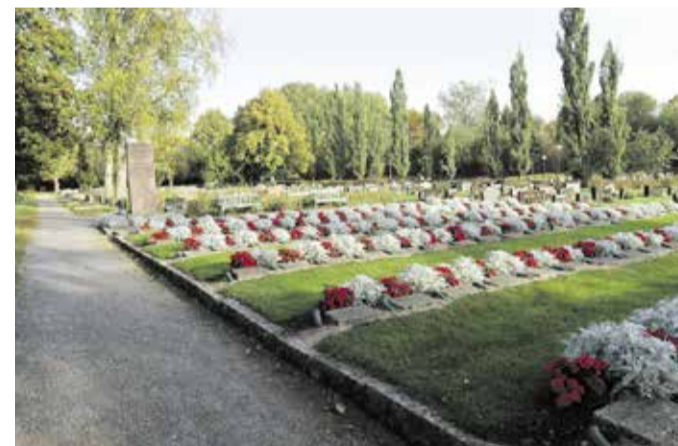
Sankarihautausmaa kukoisti kauniisti vielä syyskuun lopulla.