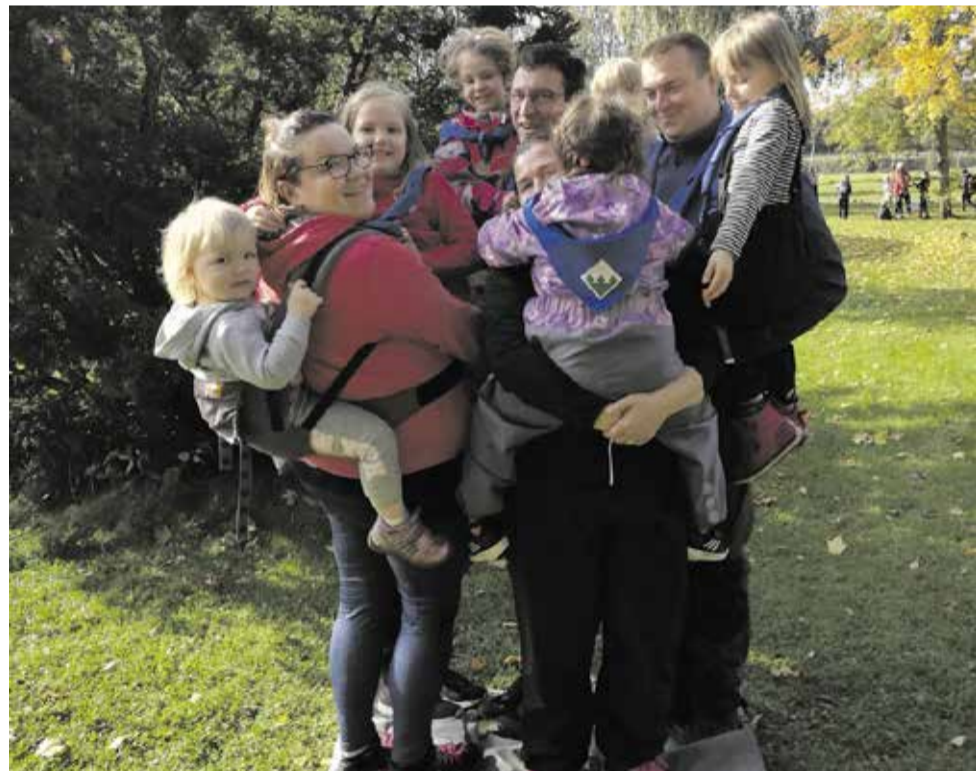
Tänä syksynä Kiskon perhepartio osallistui Perniössä järjestettyyn sudenpentujen ja seikkailijoiden riehaan.

Kirjoittaja on KisKun lippukunnanjohtaja ja kahden samoajan sekä perhepartiolaisen vanhempi.