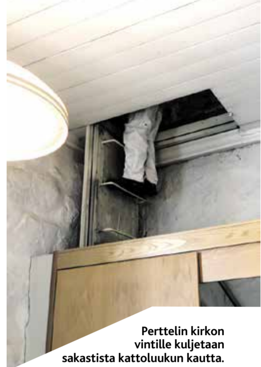
Perttelin kirkon vintille kuljetaan sakastista kattoluukun kautta.