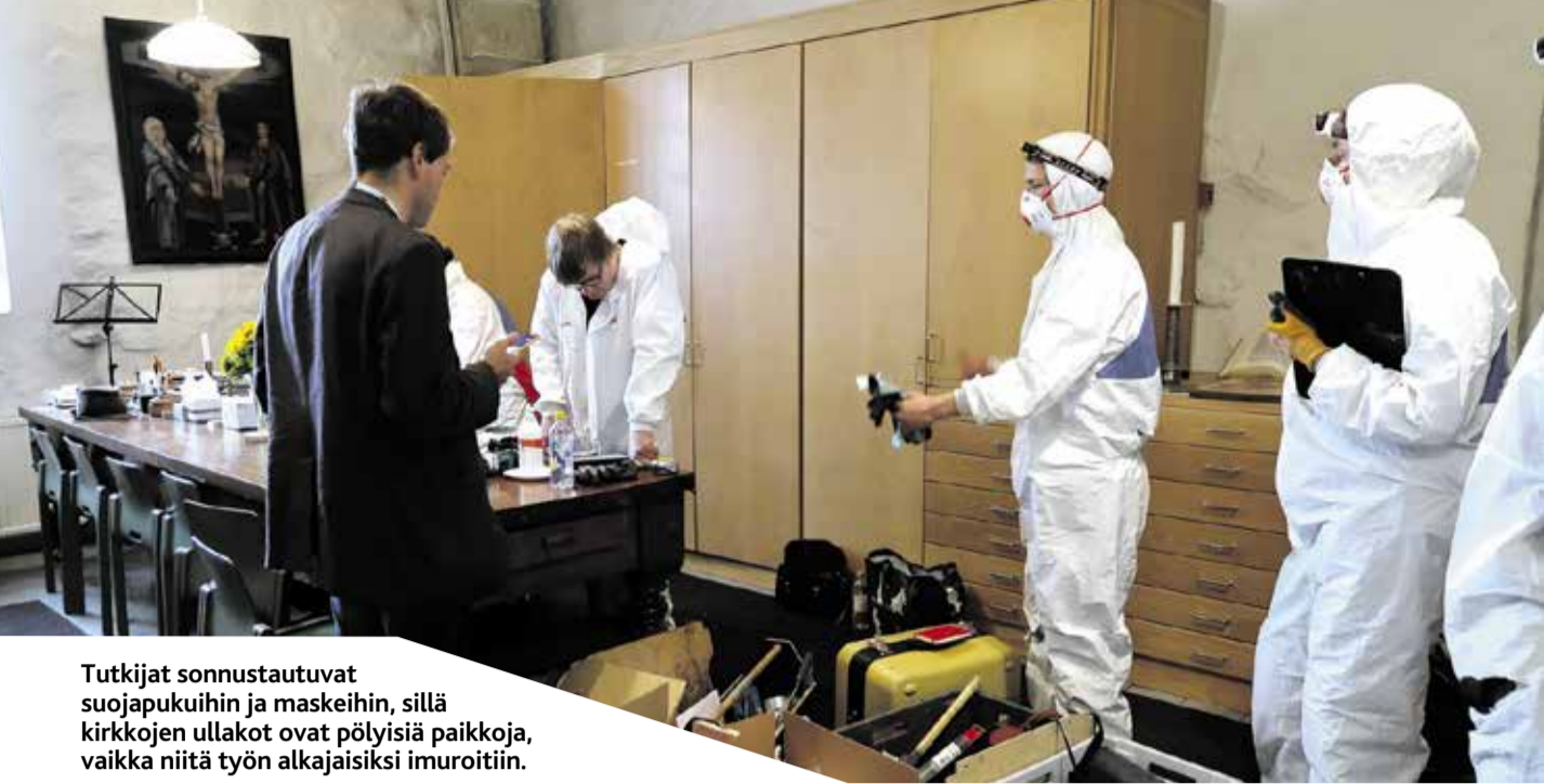
Tutkijat sonnustautuvat suojapukuihin ja maskeihin, sillä kirkkojen ullakot ovat pölyisiä paikkoja, vaikka niitä työn alkajaisiksi imuroitiin.