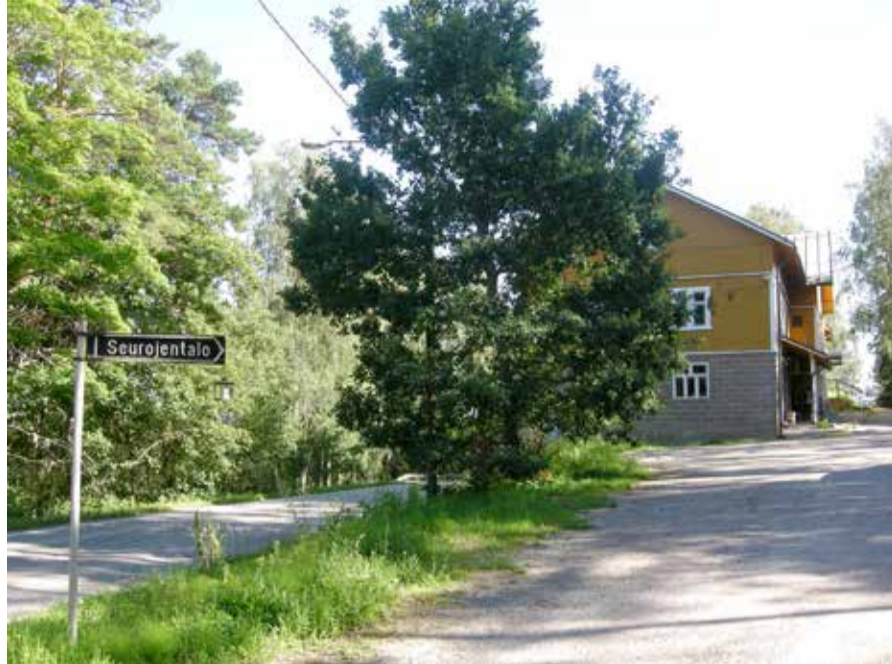
Seurojentalo Angelniemellä tai Kokkilassa – nimiä käytetään vähän päällekkäin – ottaa kattonsa alle myös Salon seurakunnan toimintoja nyt kun Angelniemen seurakuntatalo on myyty.

Seuraava isompi remonttikohde on keittiö, jonka uudistukseen tullaan anomaan rahaa Kotiseutuliitolta. Monia tarpeita kustannetaan vuokratuloilla. Niitä tulee ensinnäkin Salon kaupungilta, joka maksaa siitä, että koululaiset voivat käyttää suurta juhlasalia sisäliikuntatilana. Talossa on myös