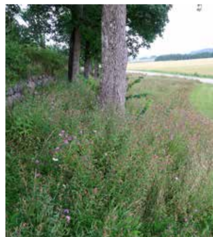
Hautausmaan kiviainan vierusta on säilytetty luonnonkukkaniitynä.

Kun hautausmaan kiviainaa aikoinaan korjattiin, tuli mietittäväksi, laitetaanko koko laaja alue aidan ja hautausmaan ympäri kiertävän tien välistä nurmikoksi. Ei laitettu, vaan jätettiin suurin osa kasvamaan