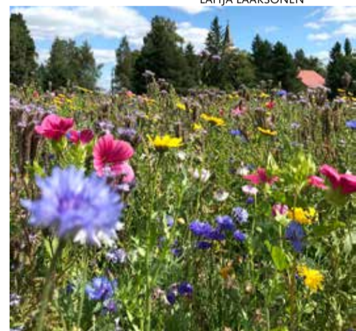
Kukkaketo on kerännyt katseita Perttelin kirkon vaiheilla.

Niityn kasvustoa on vuosien mittaan autettu kylvämällä luonnonkukkaseosta ja ennen kaikkea perkaamalla pois voikukkiä ja ohdakkeita. Myös maaperän köyhdyttäminen on niityillä tärkeää: kasvusto niitetään ja