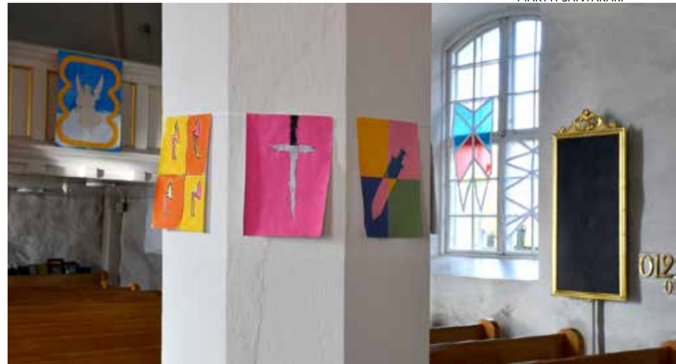
Kirkkopolkua Perttelin kirkossa.

kirkossa syksyllä 2018. Kevätkaudella 2019 hanke toteutettiin Halikossa ja Kuusjoella ja syyskaudella 2019 Perniössä ja Perttelissä. Tavoitteena on, että Kirkkopolku kiertää loputkin Salon seurakunta-alueet.