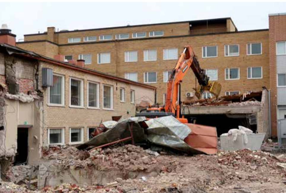
Kirkkokadun puolelta on jo kadonnut muun muassa entinen alasali.

Ykkösrakenteen leivissä purkutyömaalla ahkeroi nyt 3–4 henkilöä. Maanantaista torstaihin tehdään tavallista pidempää päivää, perjantaisin työmaalla on yleensä hiljaista. Ulkopuolisia yrittäjiä käytetään raskaimman tavaran, lähinnä betonimurskeen pois kuljettamiseen.