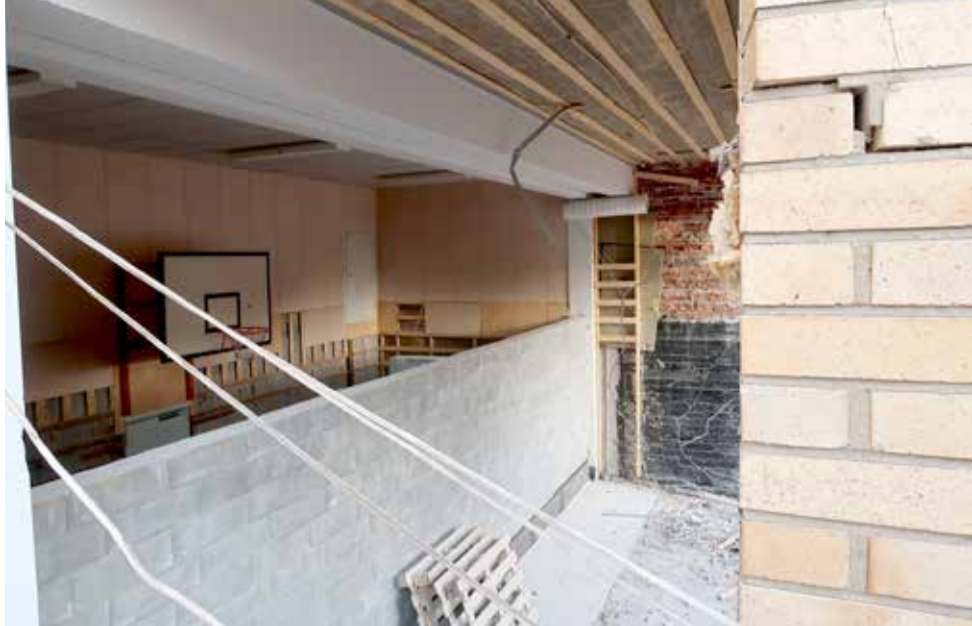
Liikuntasalin toinen pää ulottui kerrostalon (Rummunlyöjankatu 5) sisään. Siitäkin aiheutui oma haasteensa purkutyöhön.