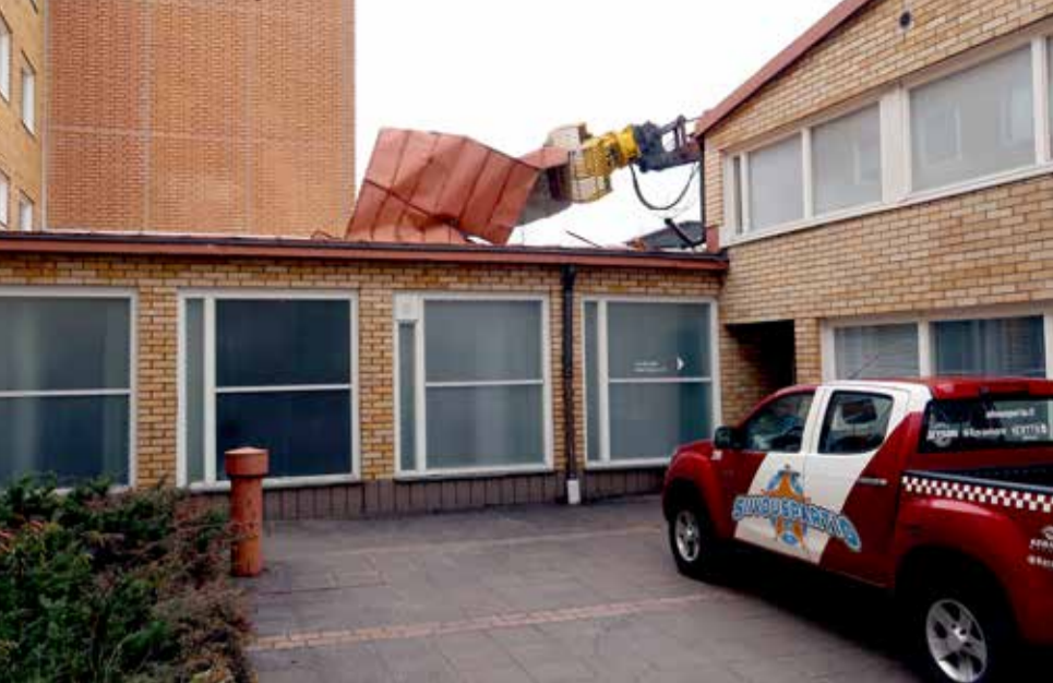
Järeän koneen koura tarttui liikuntasalin kattopelteihin maaliskuun alkupäivinä.