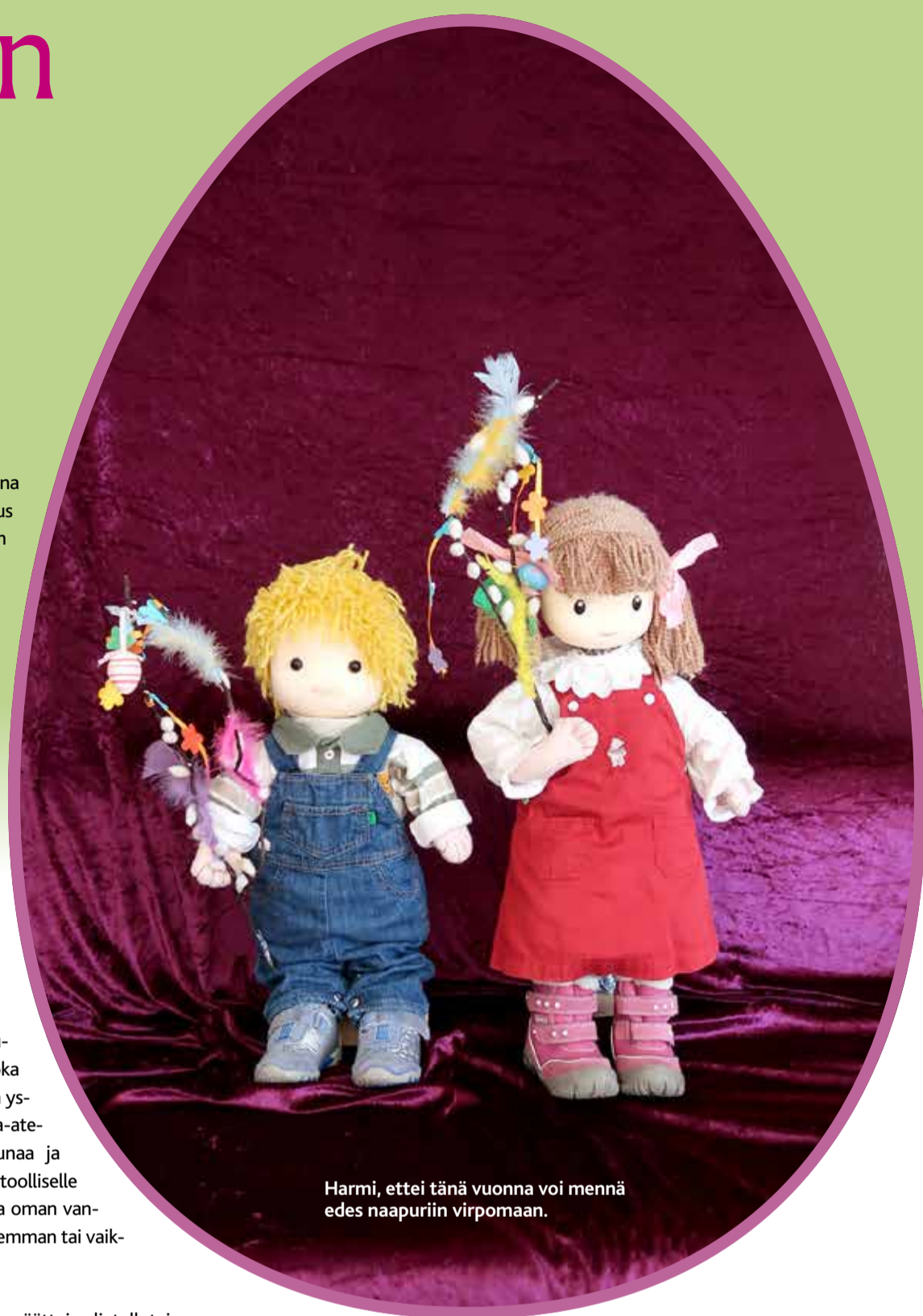
Harmi, ettei tänä vuonna voi mennä edes naapurin virpomaan.

Myös moni muu kuin Pietari käänsi Jeesukselle selkensä. Kun maaherra Pontius Pilatus kysyi ihmisiltä, miten he halusivat, että Jeesuksen käy, ihmiset huusivat: "Ristiinnaulitse hänet! Ristiinnaulitse!"